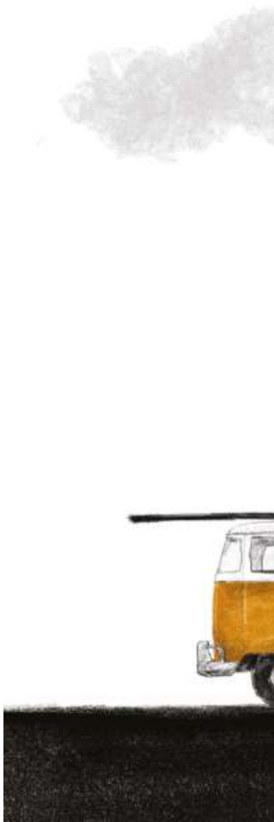
Os estudantes estão na rua, não fiques na tua!